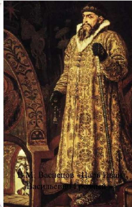
В.М. Васнецов «Царь Иван Васильевич Грозный»